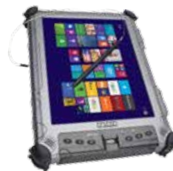
XC6 M2 Movilidad Ultra Robusta que Cumple con las más Estrictas Exigencias Militares