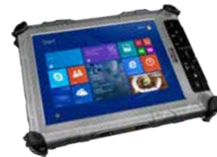
XC6 DMSR Movilidad de Modo Dual Legible bajo la Luz Solar para Ambientes Industriales y Exteriores