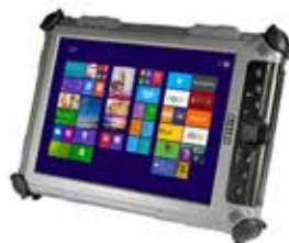
XC6 DM & DML Dos opciones Modo-Dual de Movilidad Industrial