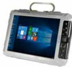
XC6 DMCR Modo-Dual, Sala Limpia, Libre de Contaminación

Hecha más fuerte que cualquier otra tableta robusta del mercado, la serie XC6 de Xplore supera a la competencia en rendimiento, características, durabilidad y capacidad de recuperación. Hemos sometido cada modelo de la tableta ultra resistente XC6 a través de desafíos rigurosos en situaciones extremas del mundo real para asegurar su resistencia inquebrantable. Estas son sin duda las tabletas más robustas del mundo: cada modelo ofrece el mismo marco ultra robusto, núcleo de procesamiento de alto rendimiento y una experiencia de computación móvil duradera.